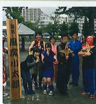
天下一忍者決定戦